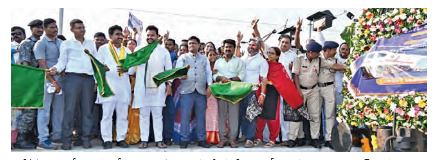
సోమవారం శ్రీకాకుళం జెండా ఊపి రైలును ప్రారంభిస్తున్న కేంద్ర మంత్రి రామ్మోహన్ నాయుడు